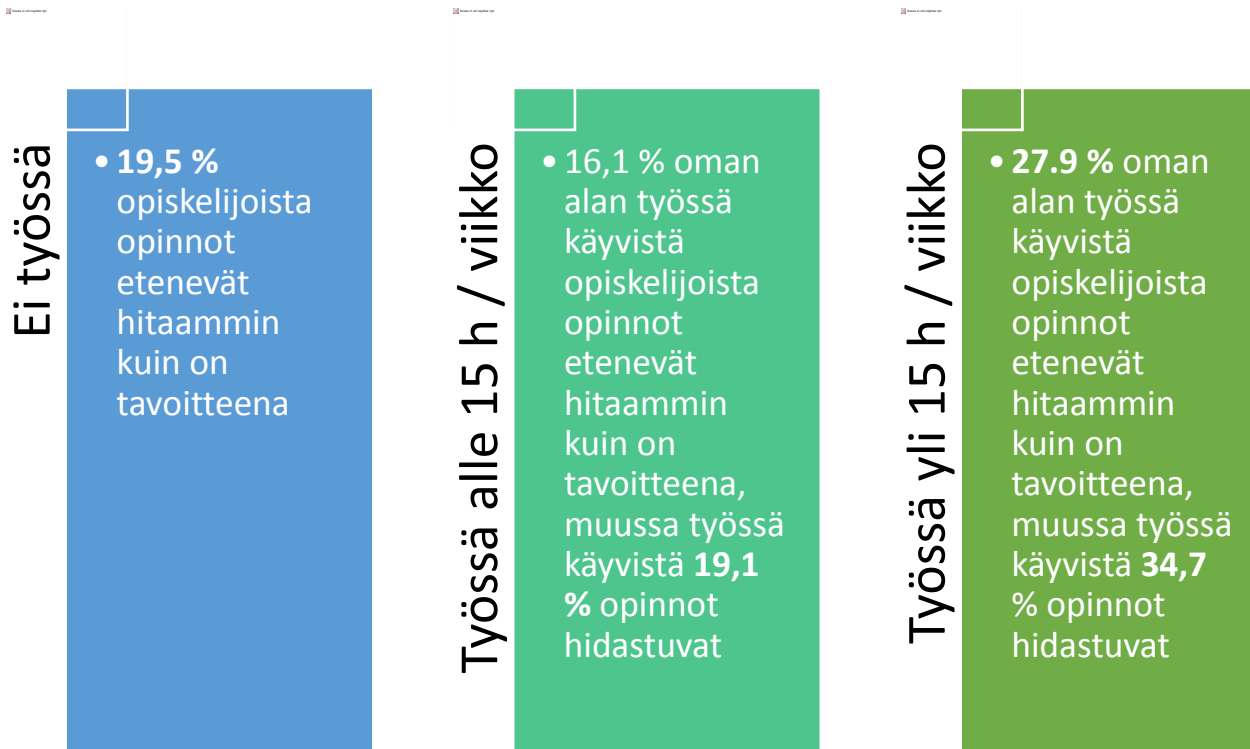
Kuvio 2. Kokemus opintojen etenemisestä suhteessa tavoitteisiin, työssäkäynnin määrään ja alavastaavuuteen (Eurostudent VI –aineistossa)