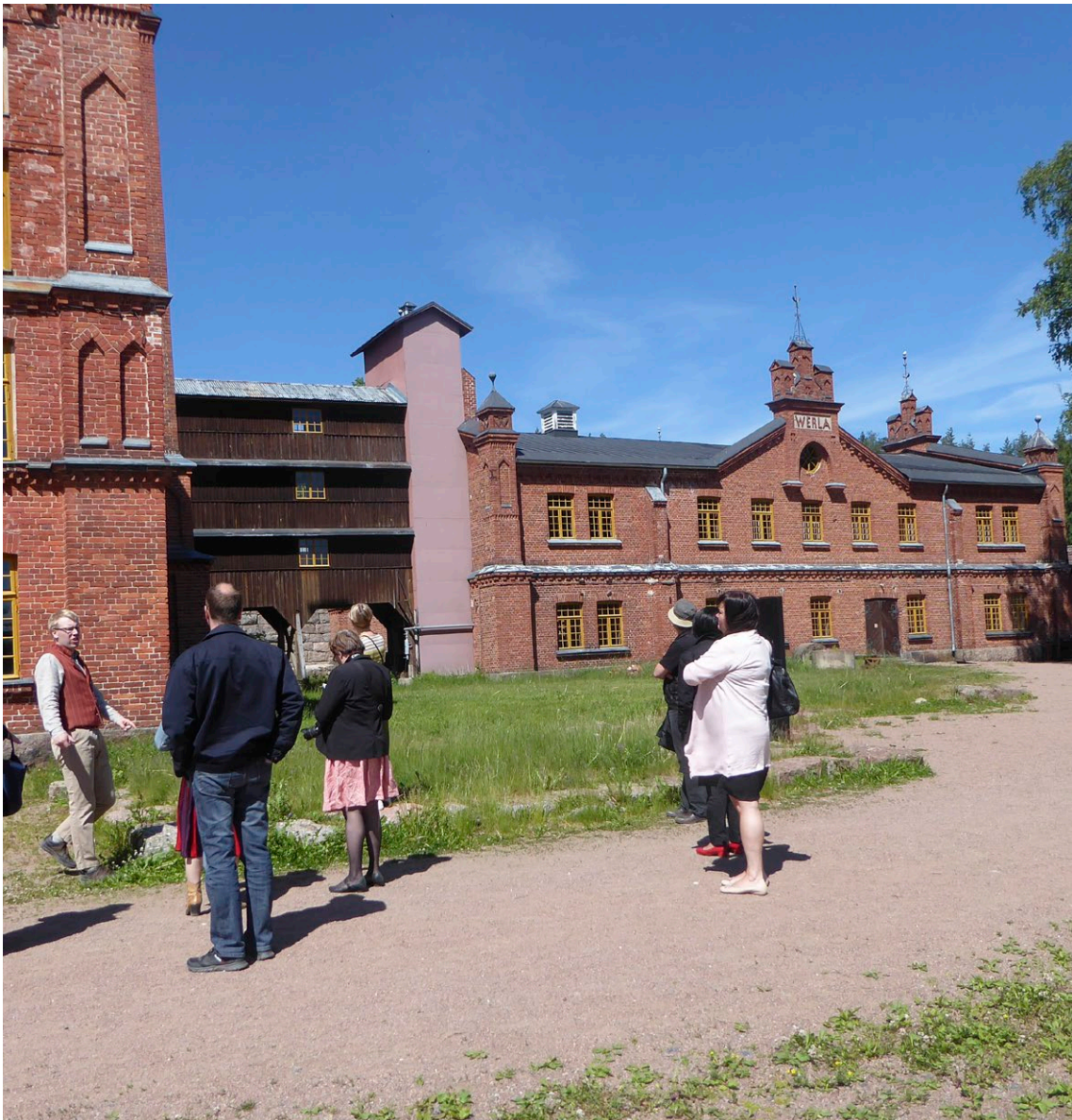
Verlan puuhiomo ja pahvitehdas.

Kansallisen maailmanperintöstrategian toimeenpanosuunnitelma vuoteen 2025