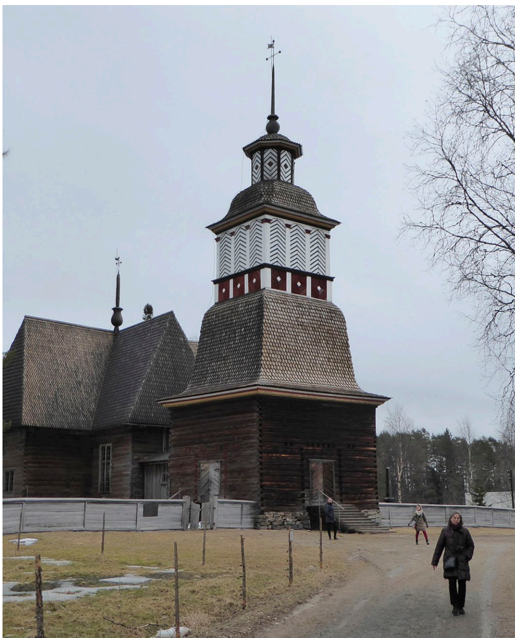
Petäjävesi gamla kyrka.