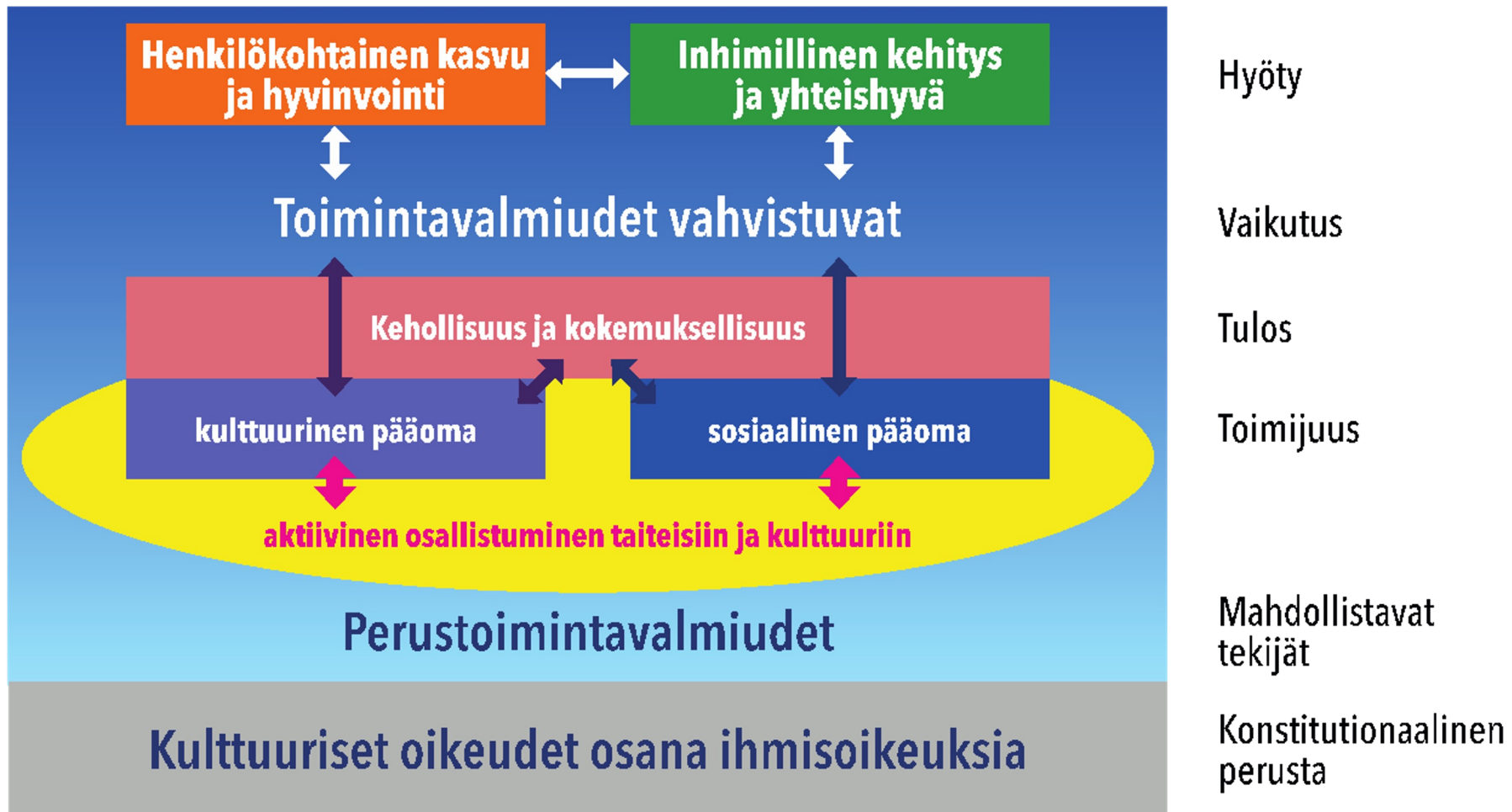
Kuvio 1. Kulttuurihyvinvoinnin toteutuminen tasa-arvon ja toimintavalmiuksien näkökulmasta.